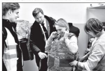
Две студентки ЮРГПУ в июле начнут дистанционно проходить практику на нашем предприятии.